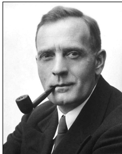
Edwin Hubble (1889-1953)

Her er v galaksens hastighed væk fra os, og d er afstanden til galaksen. Hubbles lov fortæller os noget vigtigt om Universet: Det er ikke kun galaksernes egenbevægelse , der bestemmer deres hastighed. Galakser bevæger sig ganske vist gennem rummet, men denne egenbevægelse er lille sammenlignet med den hastighed, der skyldes, at selve rummet udvider sig. Dette kaldes Universets udvidelse . Derfor ser vi, at næsten alle galakser bevæger sig væk fra os.